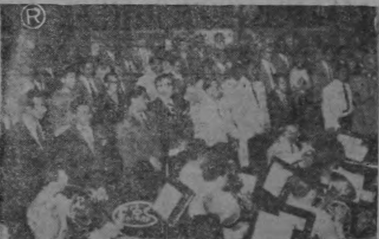
Esta parcial de los delegados sindicales del continente entero que ver hicieron acto de presencia en el Teatro Nacional