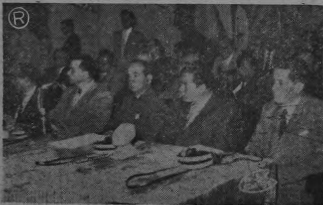
Presenta la gráfica un instante de la reunión de los personeros sindicalistas en el Teatro Nacional, con motivo de la apertura del Congreso de la ORIT. Aparecen también los Ministros don Francisco Orlich, don Jorge Rossi, don Bruce Masis, don Fernando Volio y don Uladislao Gámez.

Se celebrará en Roma durante el mes en curso, con la participación del Japón y bajo el control de la FAO (TEXTO EN PAGINA 3)