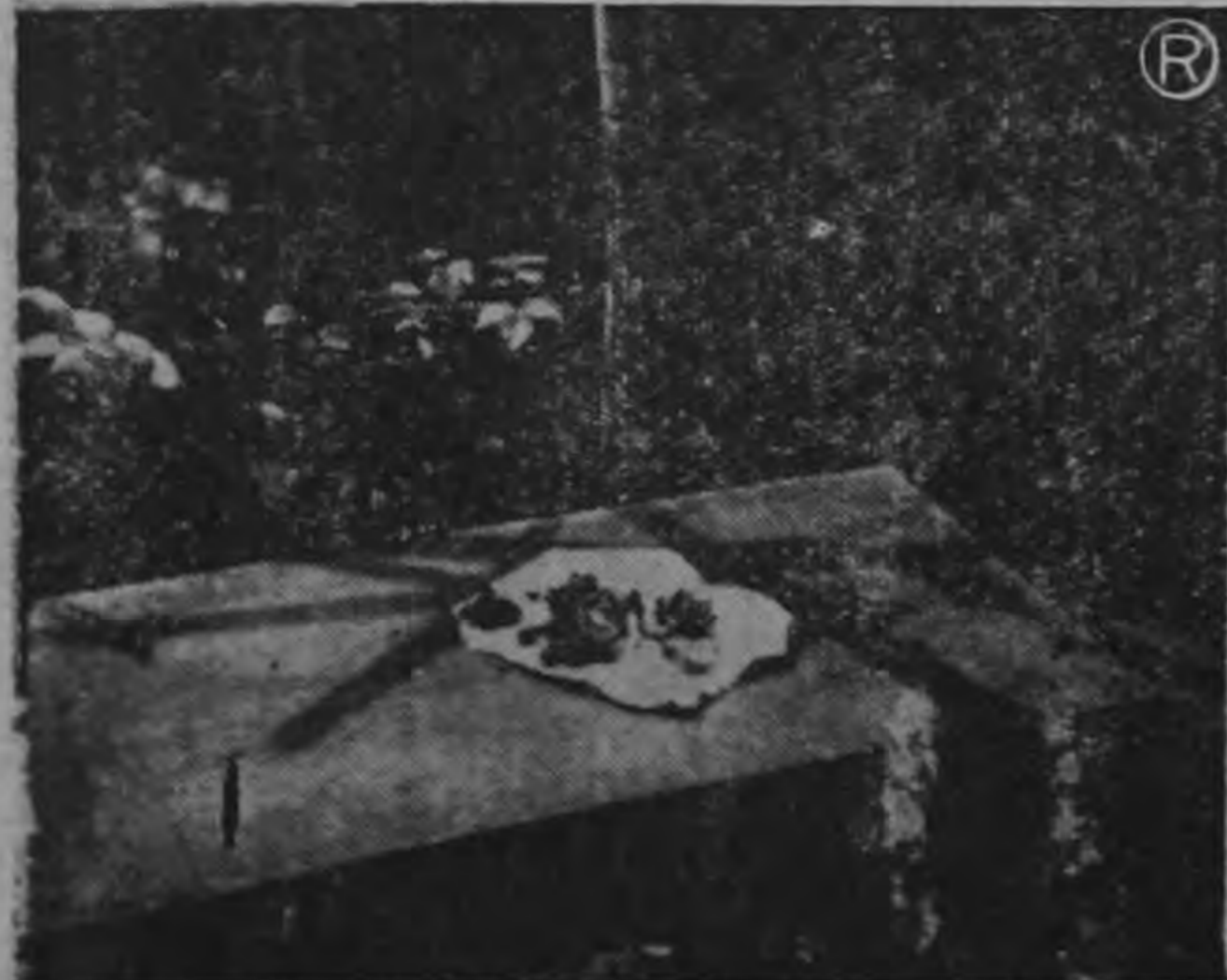
LA OSAMENTA: Esto es lo que quedó de Santana Figueroa Morales después de un año en que su cadáver permaneció a la intemperie en la montaña virgen. Solamente unos restos de lo que fue el hombre que murió asesinado a traición.